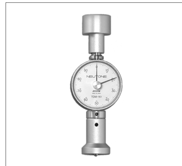
NEUTONE TDM-N1/NA1 取扱い説明書